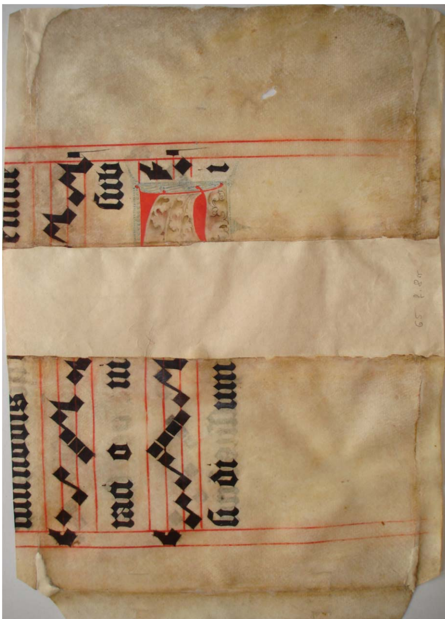
2. facsimile . Győr, Egyházmegyei Kincstár és Könyvtár, jelzet nélküli röredékanyag 8. lapja, recto