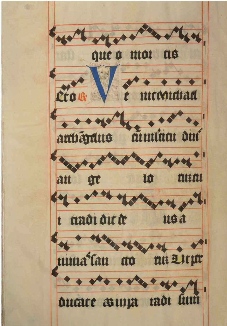
1. facsimile . Váradi Antifonále törzskézirata, Győr, Egyházmegyei Kincstár és Könyvtár, jelzet nélkül, II. kötet, f. 135v